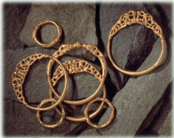
Keltischer Goldschatz, 1962 in Erstfeld gefunden